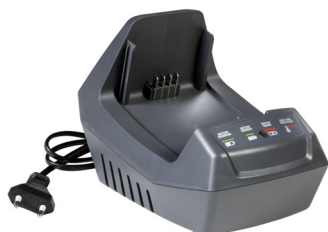
Chargeur classique CRG

Ils garantissent une recharge efficace des batteries Bi 2 OM et Bi 5 OM . Leur électronique de pointe contrôle en permanence la température et la tension de chaque cellule pour préserver leur longévité et réduire sensiblement la consommation d'énergie.