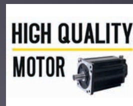
MOTEUR AVANCEMENT ET COUPE CONÇU POUR LA VIE DU PRODUIT