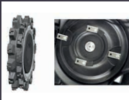
ROUES ET PLATEAU DE COUPE AUTONETTOYANT