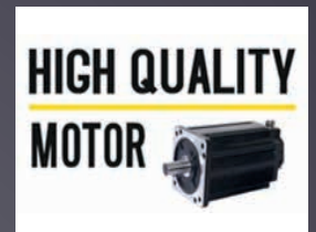
MOTEUR AVANCEMENT ET COUPE CONÇU POUR LA VIE DU PRODUIT