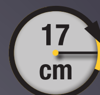
RAYON DE BRAQUAGE ULTRA COURT