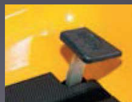
BLOCAGE DE DIFFÉRENTIEL