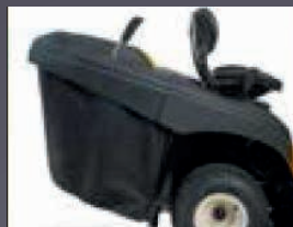
LEVIER DE BAC ESCAMOTABLE