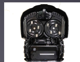
DOUBLE PLATEAU DE COUPE