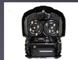
DOUBLE PLATEAU DE COUPE