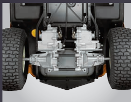
DOUBLE TRANSMISSION HYDROSTATIQUE