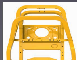
CHÂSSIS TUBULAIRE 50X50 MM