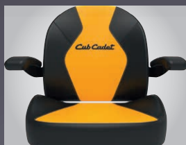
GRAND SIÈGE CONFORT AVEC ACCOUDOIRS