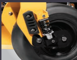
ROUES AVANT AMORTIES